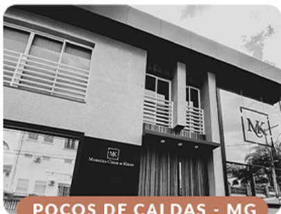
POÇOS DE CALDAS - MG