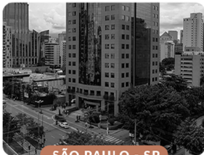
SÃO PAULO - SP