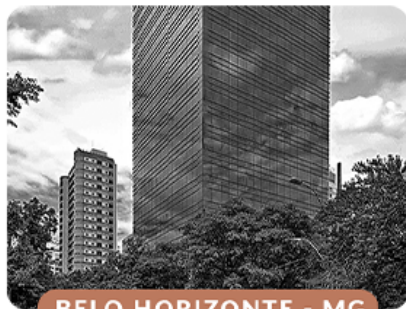
BELO HORIZONTE - MG