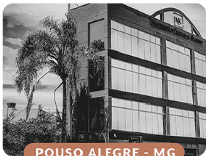
POUSO ALEGRE - MG

Veja como nosso time está preparado para atender todas as suas necessidades.