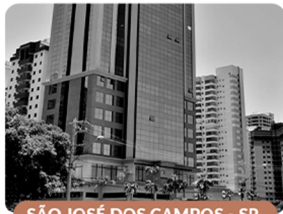
SÃO JOSÉ DOS CAMPOS - SP